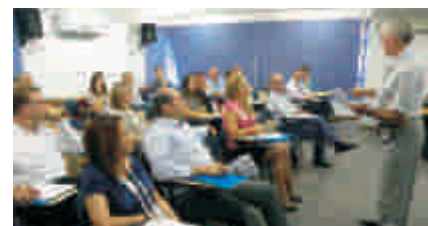
Atividades do CRA-RS na área da educação para 2012 foram apresentadas no evento

formação da comissão julgadora nas Delegacias Regionais para avaliar os melhores trabalhos.