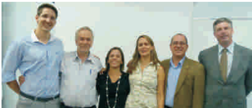
Membros das cinco Câmaras estiveram reunidos na sede do CRA-RS