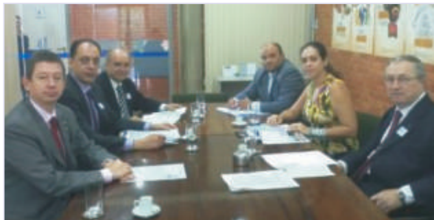
Reunião em Brasília

As entidades estão trabalhando na divulgação, em todo o Brasil, de treinamentos de formação de multiplicadores do Trabalho Decente, conceito que está baseado no respeito aos direitos no trabalho, promoção do emprego produtivo e de qualidade, extensão da proteção social e fortalecimento do diálogo social. Além disso, a parceria deve trazer benefícios exclusivos para Administradores, como cursos promovidos pela OIT. As vagas serão divulgadas em breve.