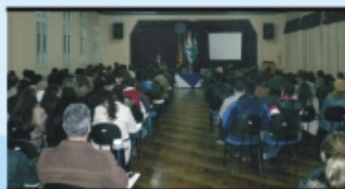
Empresários, profissionais e estudantes participaram em Livramento da palestra O BRDE no Desenvolvimento do Rio Grande do Sul