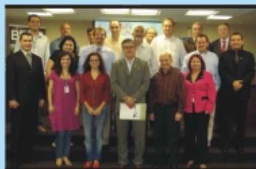
Porto Alegre: A capital foi a primeira cidade a promover a iniciativa, habilitando cerca de 15 Administradores