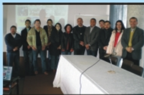
Santana do Livramento: curso realizado na Associação Comercial e Industrial qualificou dez Administradores