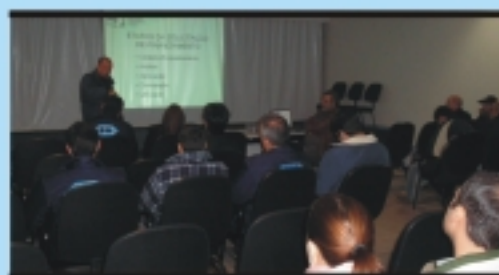
Uruguaiiana: Analista de projetos do BRDE apresenta as etapas de solicitação de financiamento junto ao banco