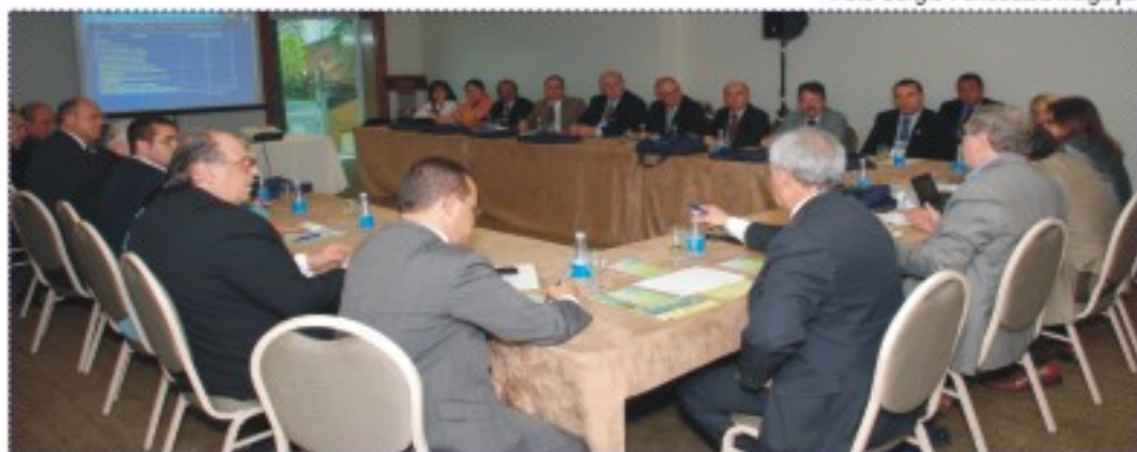
Métodos Extrajudiciais de Solução de Controvérsias foram discutidos durante evento em São Paulo