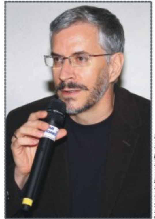
A humanização da saúde é apontada como uma tendência na área. Dario Pasche, do Ministério da Saúde, falou sobre o assunto no evento.

No 4º SAS, o Coordenador Nacional da Política de Humanização da Saúde – HumanizaSUS – do Ministério da Saúde, Dario Frederico Pasche, que também é doutor em saúde coletiva, discorreu sobre humanização na gestão; o destaque do evento. Segundo ele, é interesse do governo federal humanizar principalmente as questões referentes aos profissionais.