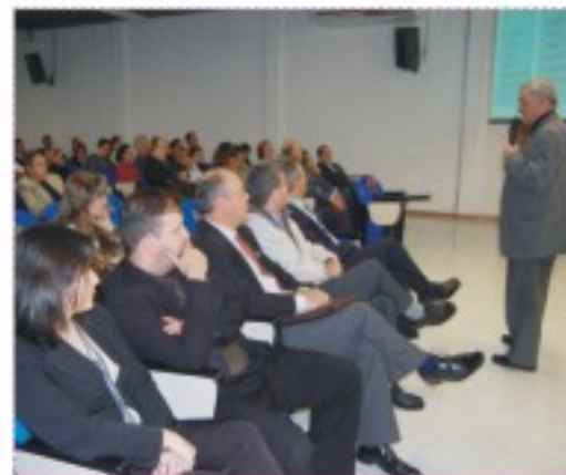
Presidente do Conselho falou sobre os MESC's como novo paradigma de Justiça aos presentes

de Controvérsias/MESCs – Uma nova cultura como alternativa de acesso à Justiça.