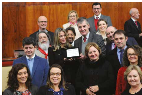
Grande expediente na Assembleia Legislativa em comemoração aos 60 anos do CEPA

Daí para o curso de graduação em Administração não demorou muito. Instituído em fevereiro de 1963, o curso de Administração de Empresas nasceu, primeiramente, dentro da Faculdade de Ciências Econômicas. Foi o primeiro da área no Rio Grande do Sul. Já em 1966, o IA passou a oferecer o curso de graduação em Administração Pública, como forma de suprir a lacuna de conhecimento que havia no segmento no RS.